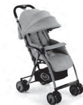
TRE.9 ThreeDotNine 3.9 Stroller